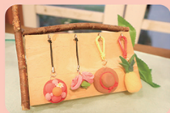
ねんどキーホルダー

・定員 ……100名 ・料金 ……700円 ・所要時間 ……45分 ・お渡し ……約60分後 小さなお子様でも体験できます。