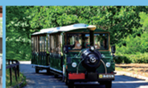
ハーベストトレイン