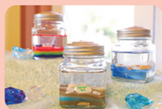
ジェルキャンドルづくり

・定員 ……100名 ・料金 ……900円 ・所要時間 ……30分 ・お渡し ……即時 小さなお子様でも体験できます。