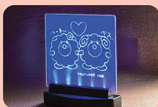
ライトスクラッチ

・定員 ……100名 ・料金 ……1,200円 ・所要時間 ……60分 ・お渡し ……約60分後 小さなお子様でも体験できます。