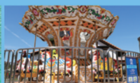
メリーゴーランド