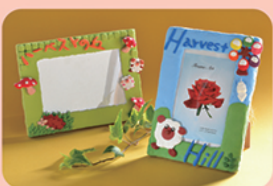
ねんどのフォトフレームづくり

・定員 ……100名 ・料金 ……1,000円 ・所要時間 ……40分 ・お渡し ……数量により変動するため お問い合わせください。 小さなお子様でも 体験できます。