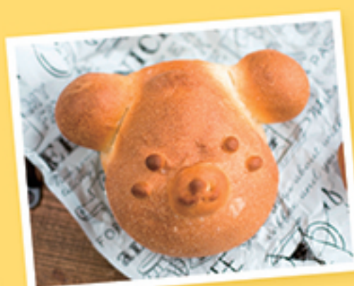
簡単に作れるパン

季節により体験できる内容が変わりますので、詳しくはお電話にてお問い合わせください。 ※メニューは約2ヶ月前に決定します。