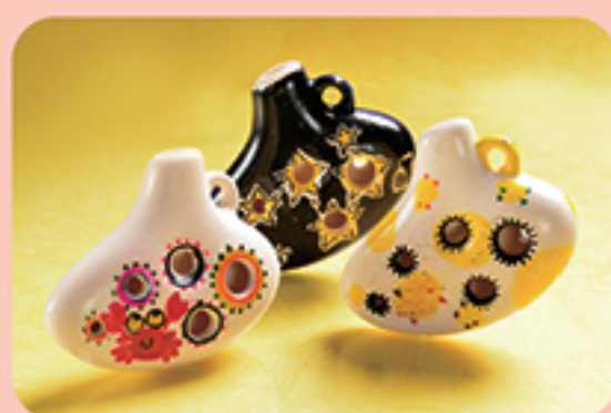
ミニオカリナの絵付け体験

・定員 ……100名 ・料金 ……800円 ・所要時間 ……60分 ・お渡し ……即時 小さなお子様でも体験できます。